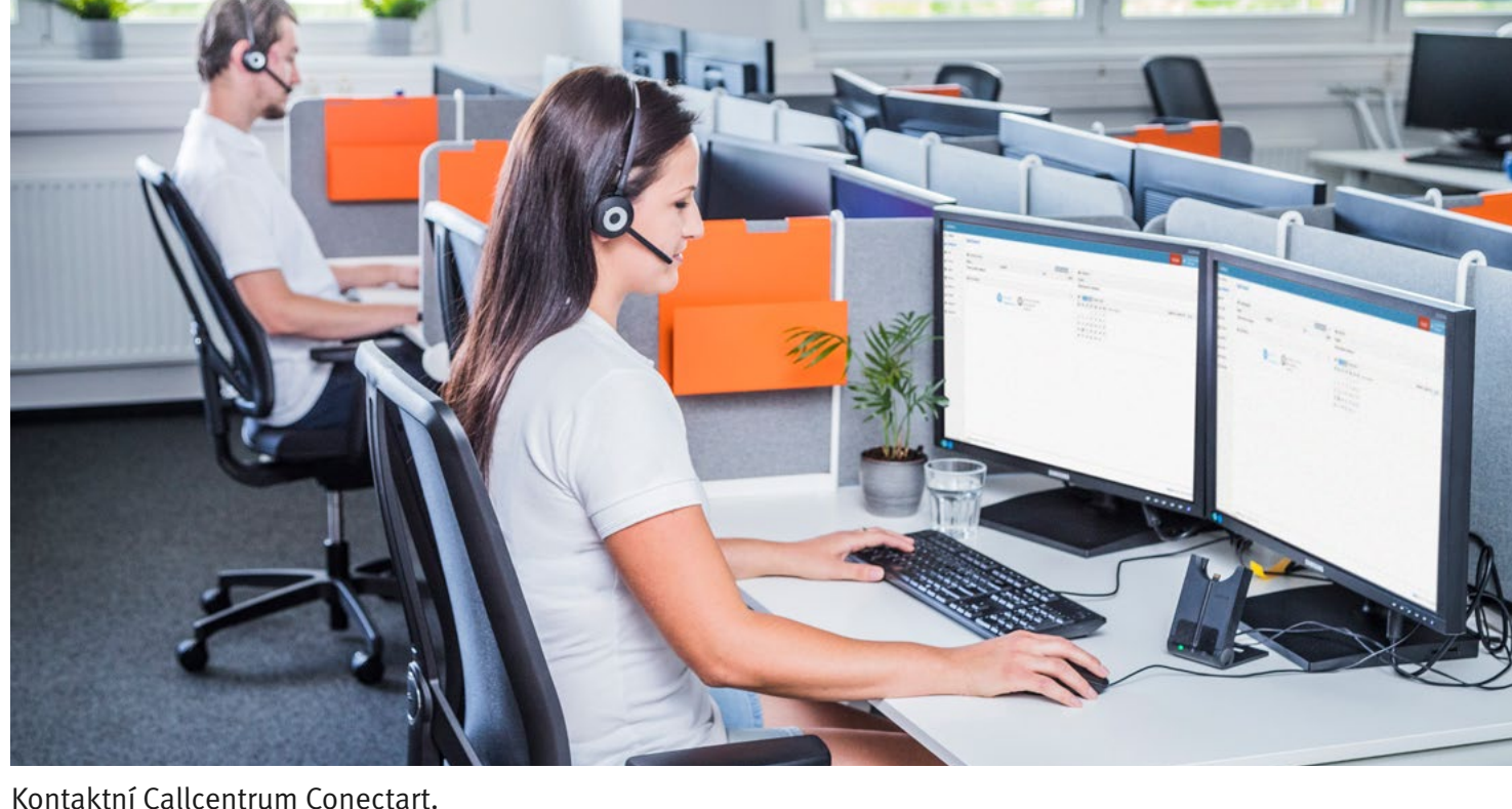
Kontaktní Callcentrum Conectart.